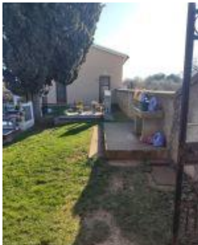
Šišan - staro