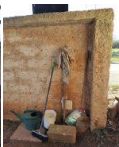
Valtura - staro